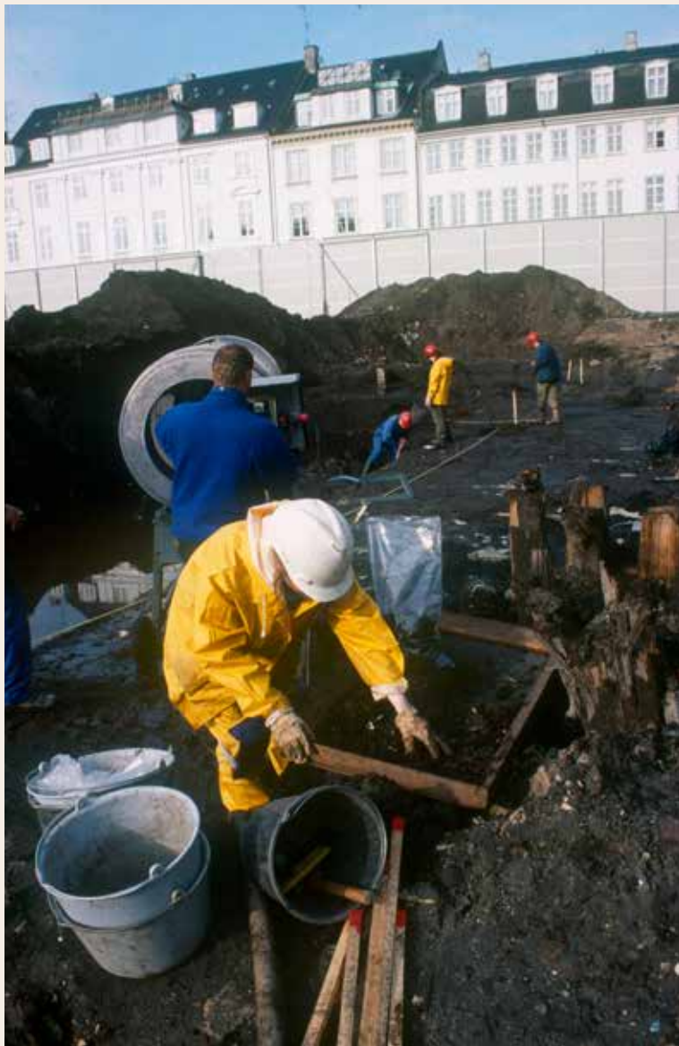
Fig. 1. Arkæologer graver på lossepladsen. 2003.