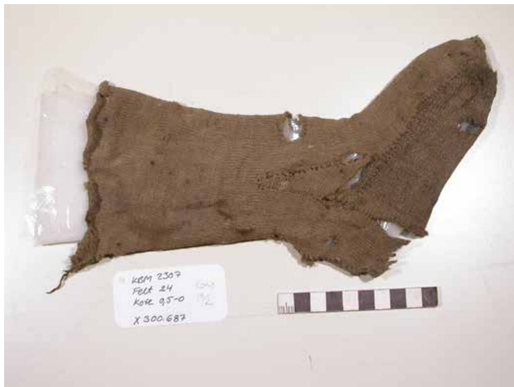
Fig. 2. Barnestrømpe lavet af skaftet fra en voksenstrømpe. 2003.