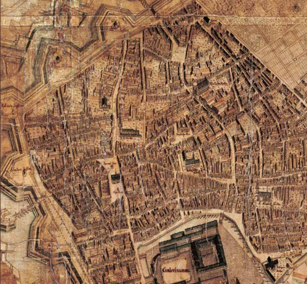
Udsnit af Geddes eleverede kort. 1761.