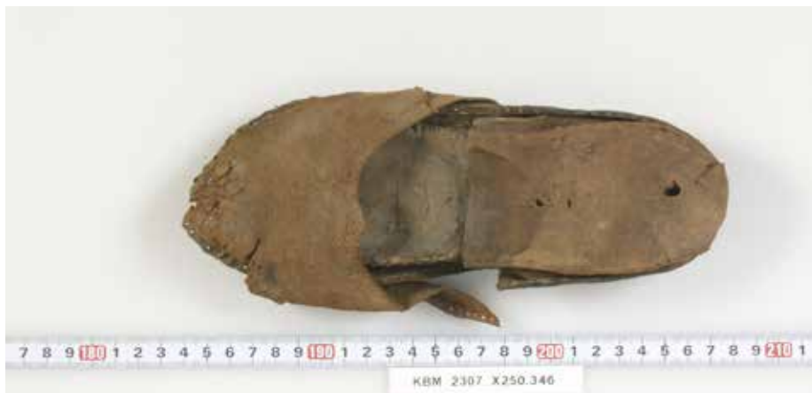
Fig. 3. Kvindesko. Københavns Museum. 2003.