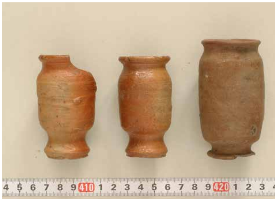
Fig. 4. Salvekrukker af stentøj. 2003.