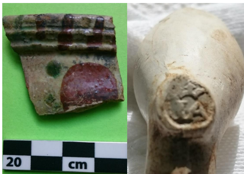
Figur 5. T.v.: mynningsfragment av trefotsgröta, yngre vitgods av Weser-typ, omkring år 1600 (KBM 4441x5076). T.h.: Holländsk kritpipa med tillverkarstämpel "IA/under krona", 1600-talets andra hälft eller omkring år 1700 (KBM 4441x5065).