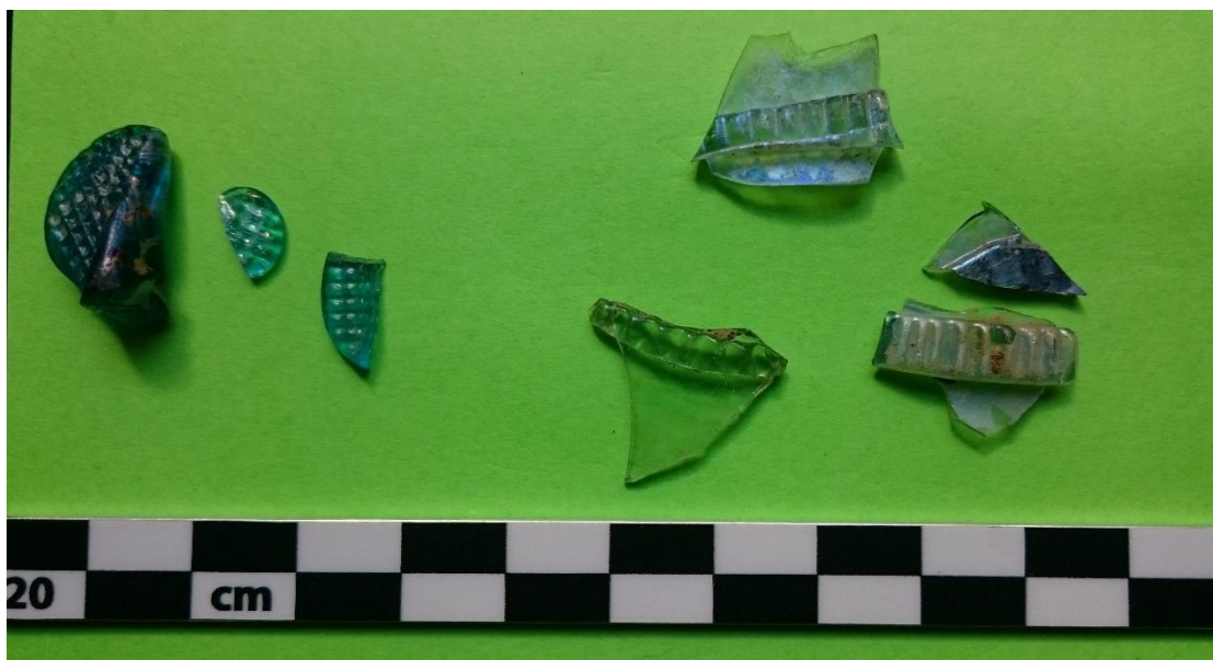
Figur 7. T.v.: fragment av blått glas från vinpokal "façon de Venice", 1600-tal. T.h. fragment av passglas med pålagda band, 1600-tal (KBM 4441x5052)