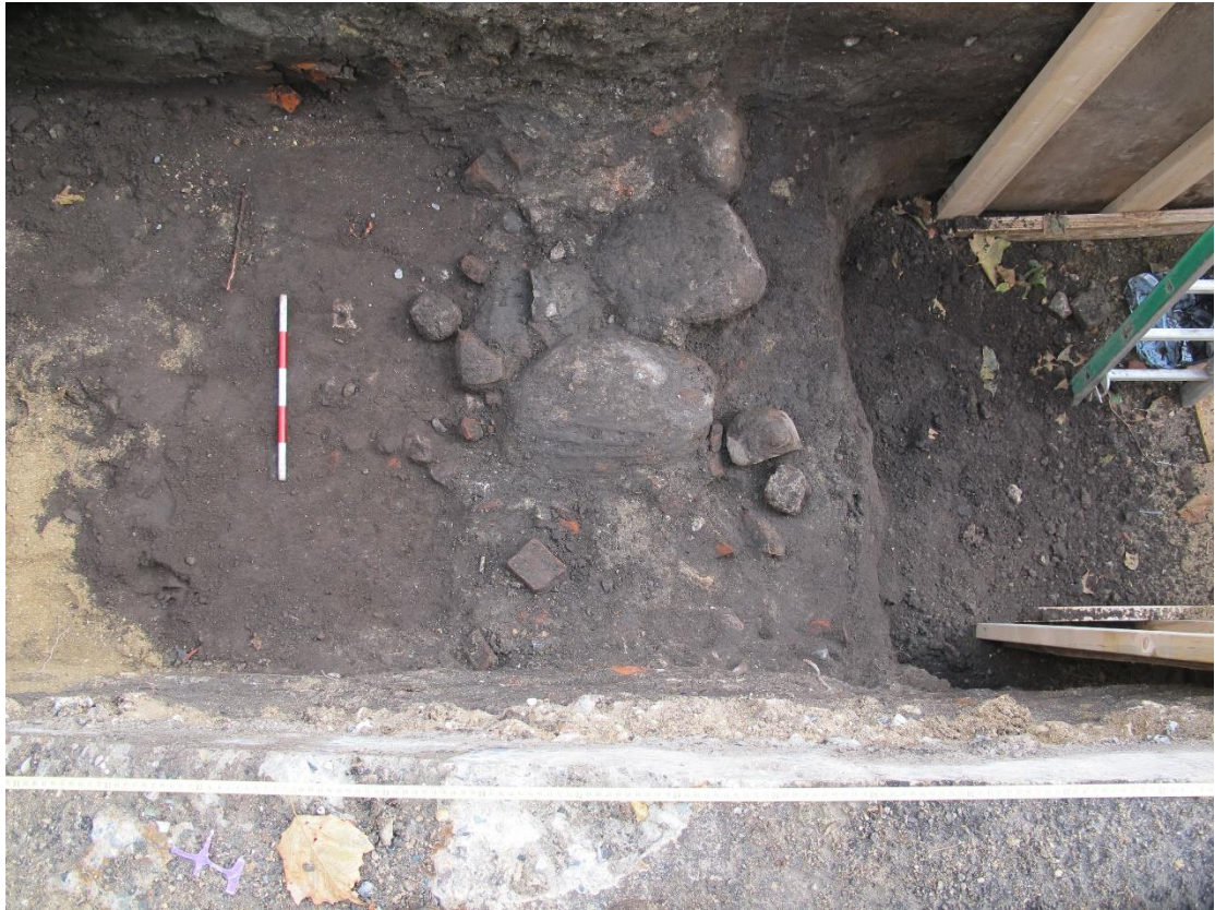
Figur 3. Grundmur av natursten (S1015) sedd mot norr.