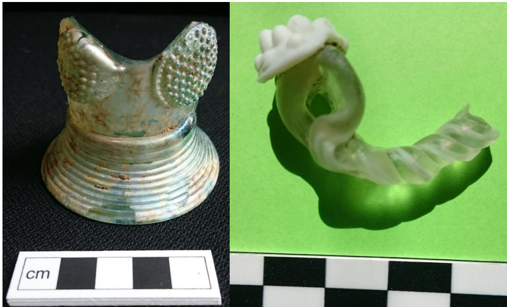
Figur 6. T.v.: nederdel av remmare med spiralformad fot och ben med knoppdekor, mitten av 1600-talet (KBM 4441x5018). T.h. dekorelement från vinpokal eller liknande i form av spiralvridet glas med pålagd "hallonknopp", mitten av 1600-talet (KBM 4441x5071).