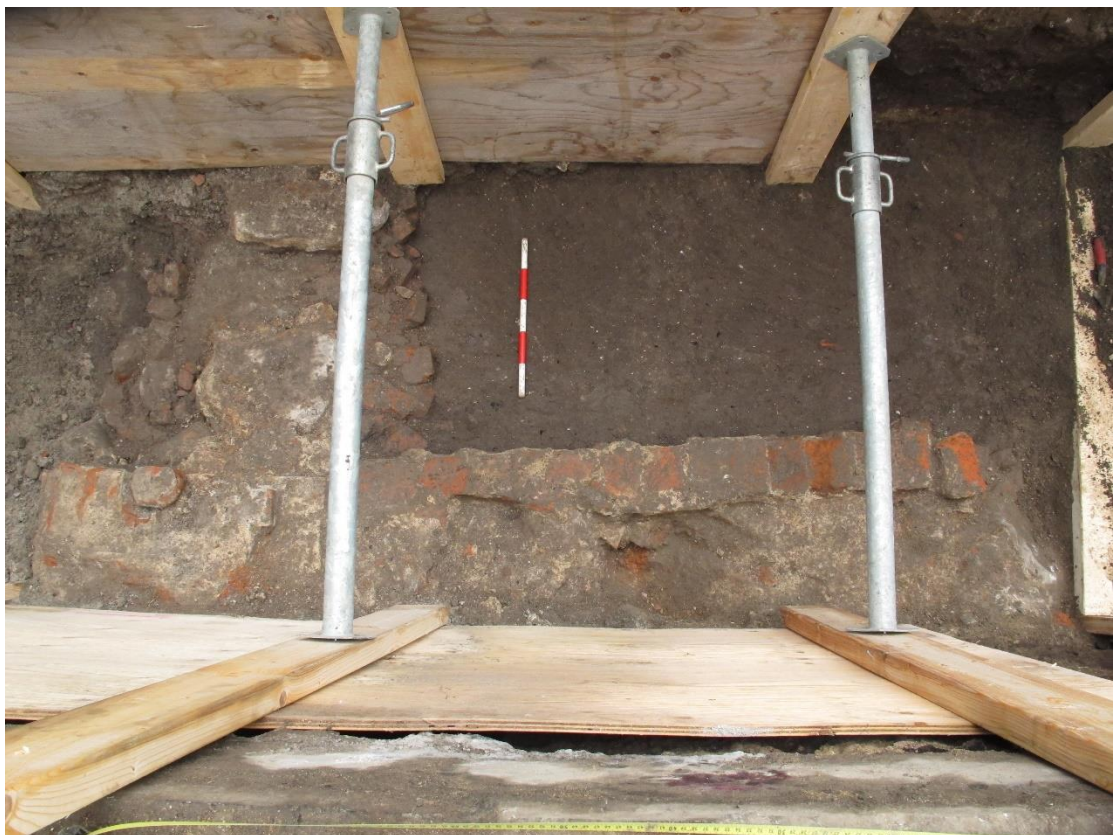
Figur 4. Källarmur av tegel i kalkbruk (S1027) sedd mot norr.