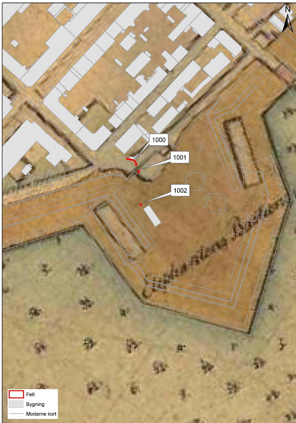
Figur 6. De opmålte felter placeret på Schlegel kort fra 1814 (Ingeniørkorpsets tegninger over Københavns Befæstning).