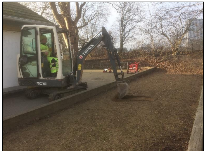
Figur 2 og 3. Hullet ved trappen op til Elefantens Bastion ved Christianshavns Voldgade, set fra syd. Hul ved petanquebanen på legepladsen, set nord.

Den 28. februar 2019 blev der grave et kabel ned langs fortovet, og en meter ud i Christianshavns Voldgade, hvorfra der underbores på tværs af vejen. Den samlede længde på traceet var godt otte meter. Det var 30 cm bredt langs fortovet, og 60 cm bredt i vejen. Dybden var ca. 50 cm, og der graves kun ned til det gamle telefonkabel. Fyldet var gråbrunt gruset, omrodet jord og stabilgrus. Der graves kun i lag der tidligere har været gravet op, blandt andet i forbindelse med nedlæggelsen af telefonkabler. Der blev ikke observeret hverken faste konstruktioner eller lag af kulturhistorisk interesse.