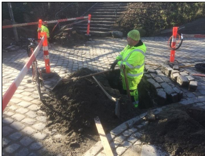
Figur 5. Hul i vejen ved Christianshavns Voldgade, hvorfra kablet fra tracéet på figur 4 bliver underboret, set fra nord. Tracéet er markeret med gul streg på figur 1.

Afsluttende blev sende- og modtagehullerne samt det opgravede tracé opmålt med GPS. Opmålingsfilerne opbevares i IntraSis – IntraSis projekt K2019:11.