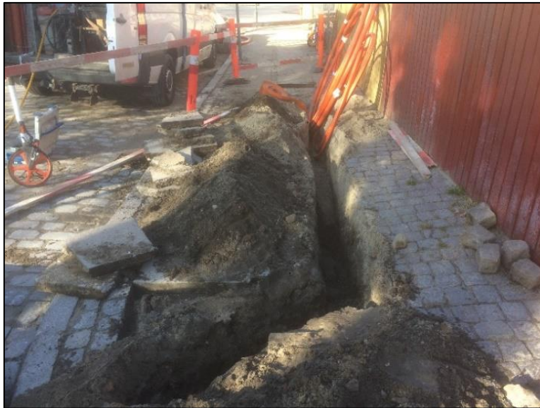
Figur 4. Kabeltracéet ved fortovet på Christianshavns Voldgade, set fra øst. Tracéet er markeret med gul streg på figur 1.