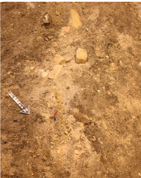
Mørtelspor og ødelagt gule mursten i Rum 2

Endvidere blev der fundet spor af mørtel og ødelagte gule mursten i nordøst-sydvestgående retning. Det er muligt, at der havde været en enkelt række af mursten, som er blevet gravet væk ved det tidligere arbejde i kælderen.