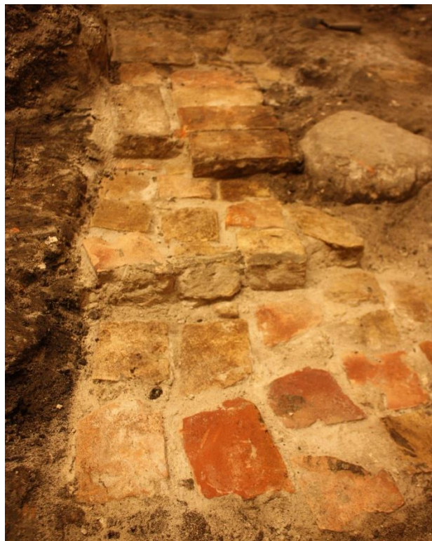
Resterne af muren i Rum 1 set fra vest

Der blev i forbindelse med udgravningen af muren fundet et enkelt keramikskår, som desværre ikke kunne anvendes til en nærmere tidsbestemmelse. De to store fundamentsten kommer fra den eksisterende bygning. Maskinføreren gravede dem fra i forbindelse med understøbningen. I den forbindelse vedkender maskinfører også at have bortgravet mursten svarende til dem der blev fundet under sonderingen.