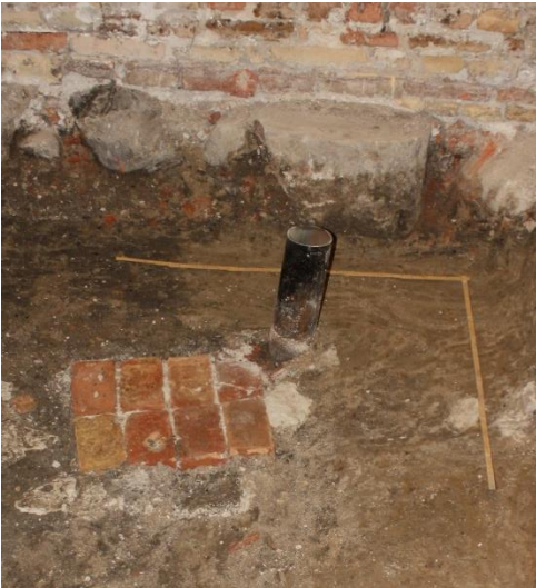
Mulig fortsættelse af muren fra Rum 1

I den sydlige ende af rum 2 fandtes yderligere rester af en mur. Det er muligt, at dette kan være fortsættelsen på muren inde fra Rum 1.