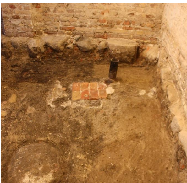
Sydlig ende af Rum 2. De forskellige lag ses tydeligt i fladen, samt den førnævnte murstensvæg.

I forbindelse med det førnævnte lag blev der fundet et 2,5 cm tykt brun-gult lerlag. Dette fandtes op langs skillevæggen, og gik ca. 65-75 cm ud fra væggen og blev fundet i skillevæggens fulde længde på 7,1 meter. I midten af rummet fandtes et tredje lag, som var bestående af løs brun-gul sandet grus, som indeholdte både røde og gule mursten, samt en jævn forekomst af knogler, søm og trækul.