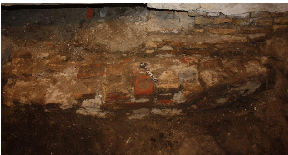
Murstensvæg i Rum 2 set fra syd

Der blev i forbindelse med udgravningen af muren fundet et enkelt keramikskår, som desværre ikke kunne anvendes til en nærmere tidsbestemmelse. De to store fundamentsten kommer fra den eksisterende bygning. Maskinføreren gravede dem fra i forbindelse med understøbningen. I den forbindelse vedkender maskinfører også at have bortgravet mursten svarende til dem der blev fundet under sonderingen.