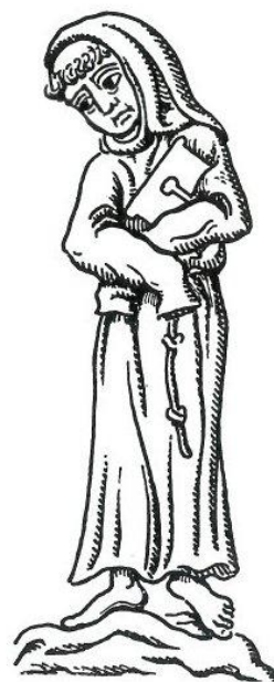
Figur 3. Franciskanermunk tegnet af Peter Linde efter "Gråbrødretorv". Fra Tønnesen 1988:338

Selvom navnet Gråbrødretorv kun er godt halvandet hundred år gammelt, markerer det dybe historiske rødder helt tilbage til byens tidlige århundreder. Området har i begyndelsen af middelalderen ligget i landlige omgivelser tæt ved fiskehandelspladsen Købmændenes Havn vest for det nuværende Gammel Strand. Her var på det tidspunkt rigelig med plads, og i 1238 fik en gruppe franciskanermunke stillet en grund til rådighed med henblik på at oprette et gråbrødrekloster. Navnene Klosterstræde, Gråbrødrestræde og Gråbrødretorv minder endnu om det forsvundne kloster. Grunden havde en størrelse på ca. 2 hektar, der strakte sig fra Klosterstræde til Købmagergade og fra Skindergade til Valkendorfsvej. Det er muligt, at der har været en bebyggelse, som kunne tjene som en foreløbig ramme for brødrene, indtil man kunne bygge noget nyt. Det vides, at opførelsen af klosteret må være påbegyndt senest i 1248, eller at der var bygninger på grunden, idet Lübeck i 1266 gik ind på at betale