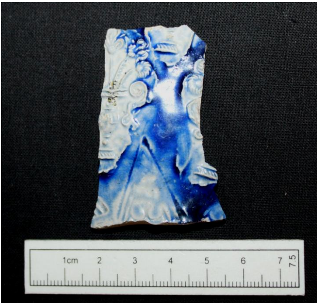
Fig. 3: Bugskår med plastisk dekoration fra kande produceret i Westerwald (x22).

Skåret stammer fra en dekoreret kande produceret i tyske Westerwald (x22, Fig. 3). Skåret er blåmalet, og den er plastiske dekoration ser ud til at være vaser med blomster i. Dateringen ligger fra 1600tallet og fremefter.