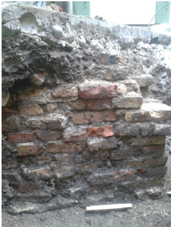
Figur 9. S100002 brolægning.

ikke undersøges nærmere, da der ikke skulle graves yderligere i den retning. Glassene lader alle til at være produceret på maskine, hvilket betyder, at dateringen må være fra 1800-tallet og frem.