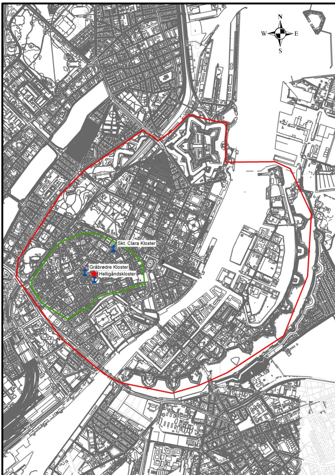
Figur 1. Placeringen af KBM 4013 Gråbrødretorv 5 (rød stjerne).