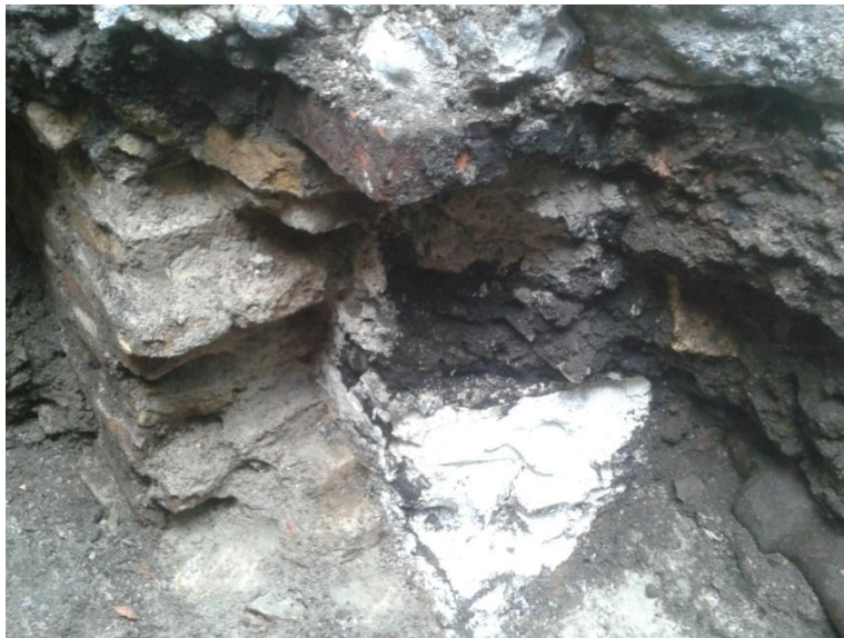
Figur 10. Ved nebyrning af fundamentet fremkom tre lagsekvenser S100004, S100005 og S100006).

Lagene synes at være deponeret over kort tid og kan muligvis tolkes som værende udsmid. Den hvide kalkagtige substans kan muligvis være en rest fra kalkning af en bygning, som er blevet kasseret i et hjørne. Om der er tale om at fundamentet har været en brønd kan desværre ikke siges med sikkerhed, men er bestemt en mulighed.