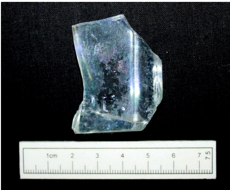
Fig. 1: Skår fra en mulig sekskantet flaske med bogstaverne ER. Bevaret (x10).

Der er fundet fire genstande i metal. Tre af disse stammer fra let korroderede søm (x11). Den sidste genstand et fladt stykke metal med hul i midten, og der må være tale om en spændeskive (x12). Det er ikke muligt at give en datering på genstandene i metal.