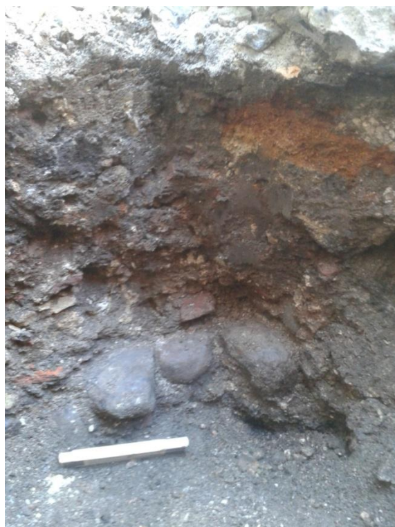
Figur 11. S100012. Københavns Museum.

Generelt var opfyldet (S100003) i traceet meget ensartet og indeholdt en del genstande. Disse dateres bredt til 1500-1900 med en overvægt til 1600-tallet (se bilag 1, side 5f).