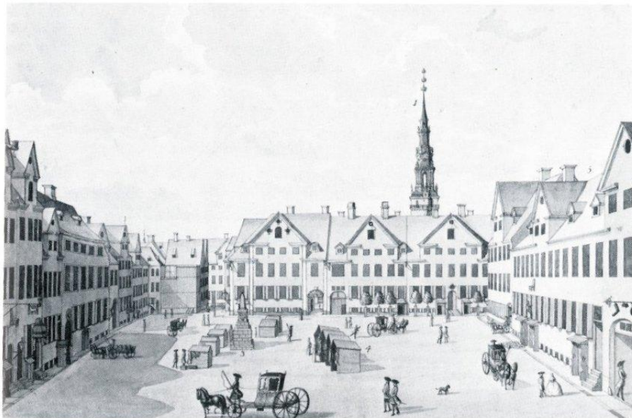
Figur 4. Gråbrødretorv 1755. Tegning af J.J. Bruun 1755. Københavns Museum.

I starten af 1800-tallet har der ude på pladsen været en del små slagterboder, som blev fjernet i forbindelse med, at man ryddede torvet og ændrede navnet fra Ulfeldts Plads til Gråbrødretorv i 1841. I 1850'erne rejste man en støbejernskonstruktion i hele torvets længde, hvorfra en snes slagtere helt frem til 1902 havde udsalg. Herefter blev pladsen igen ryddet for slagterboder, husene