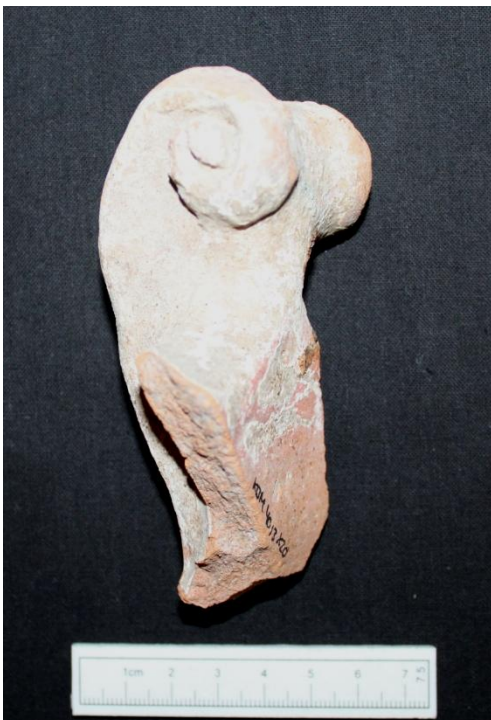
Fig. 2: Volutformet hank fra en havevase (x20).

Af dekoreret lertøj ses et dekorativt element fra en havevase (x20, Fig. 2). Der ses en volutformet hank, som på hele fladen er dækket med en tyk, hvid pibelpersbegitning, og der kan ses mulige spor efter en glasering. Dateringen på vasen kan være fra 1600tallet og fremefter.