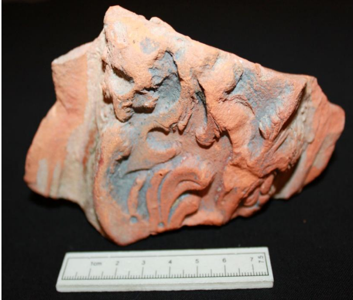
Fig. 4: Kakkelfragment med rig reliefdekoration (x25).

Der er fundet et fragment fra en kakkal med en rig reliefdekoration (x25, Fig. 4). Dekorationen er floralt inspireret, og kaklen er uglaseret, men der ses spor efter grafit sværte. Man sværte i 1600tallet kaklerne sorte for at de skulle lignende de langt dyrere støbejernsovne.