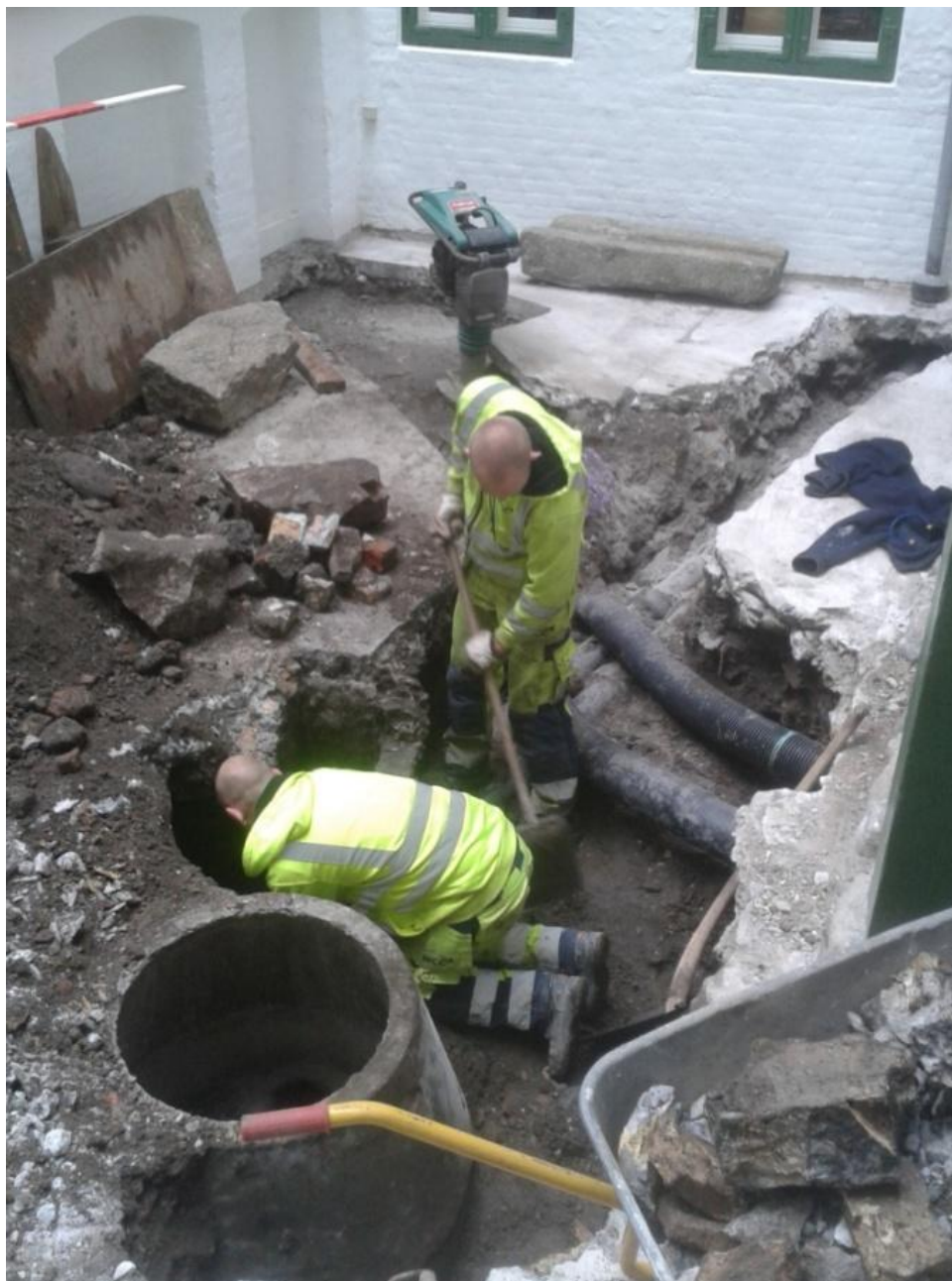
Figur 5. Arbejdsfoto over udgravningsforholdene.

Da entreprenørens erfarne gravefolk i flere år har samarbejdet med museet på anlægsarbejder blev der udvist stor forståelse for det arkæologiske arbejde og indgik i tæt samarbejde med udgravning af anlæg samt genstande.