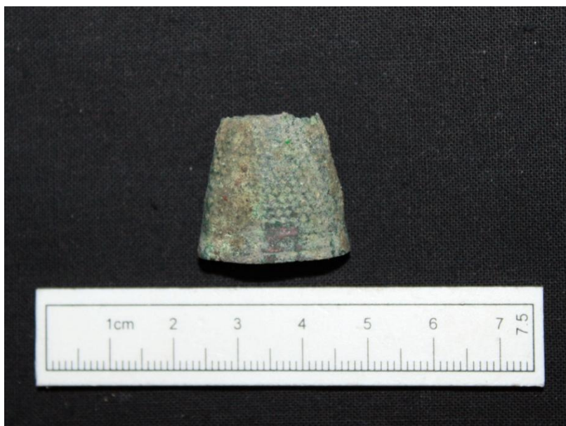
Fig. 5: Lille velbevaret fingerbølle, men hvor toppen dog mangler (x36).

Der er fundet et fingerbøl, som grundet den let grønne ir må være lavet i en kobber-messing legering (x36, Fig. 5). Fingerbøllet mangler toppen og det er lidt usikkert om det aldrig har været eller blot er korroderet væk. Designet på fingerbøllet kendes over en lang periode og denne her kan i princippet være lige fra 1500tallet og fremefter.