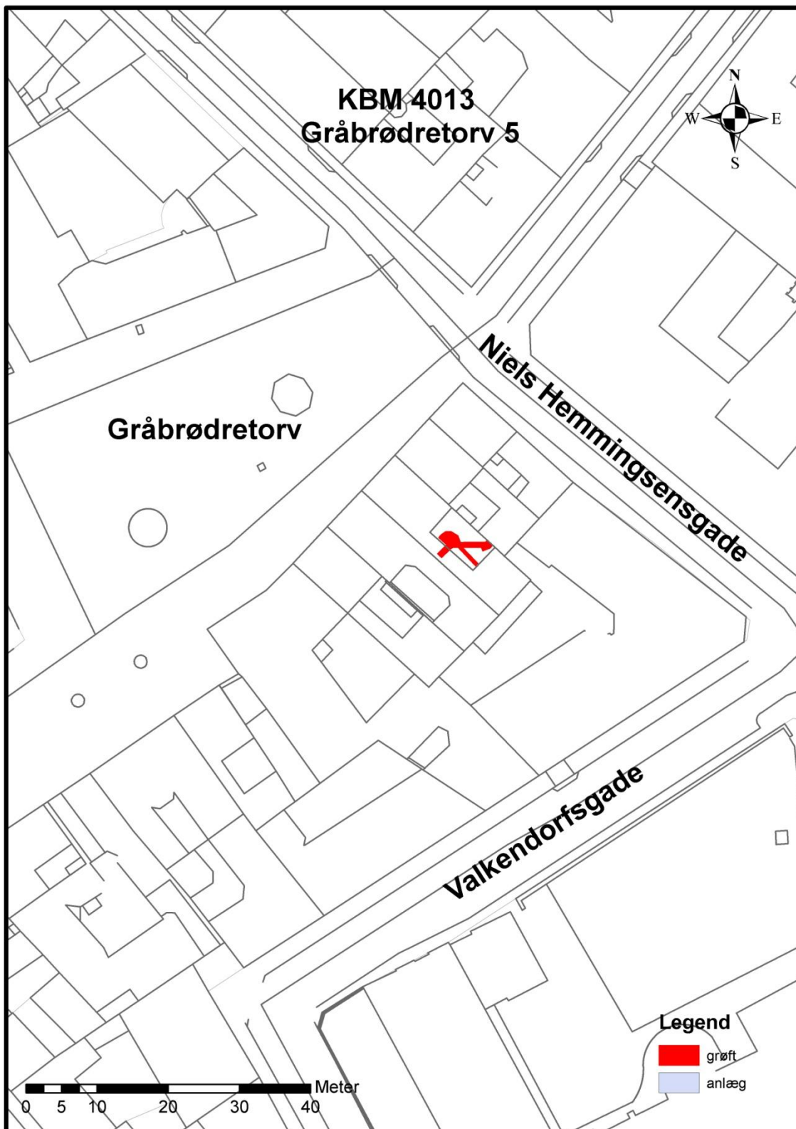
Figur 2. Grøfternes placering på matriklen.