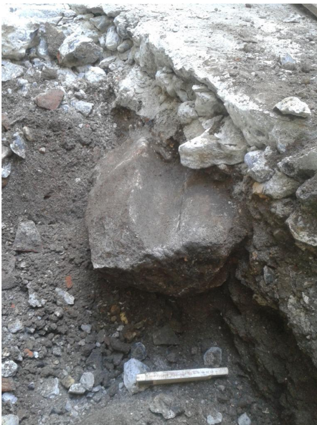
Figur 8. S100007 granitblok med fordybning. Københavns Museum.