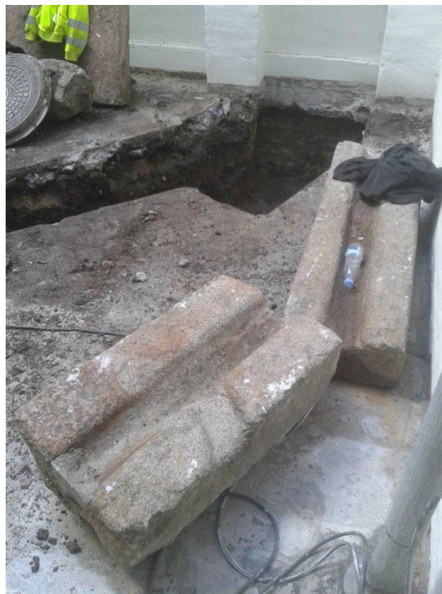
Figur 7. Granitblokke der har fungeret som pynt stående i baggården. Københavns Museum.

Der blev fundet flere fragmenter af granitblokke med en forarbejdet fordybning i midten til vandafledning (S100007). Vandrenderne må være sekundært placeret grundet deres fragmentering, placering og orientering. Som dekoration i baggården havde der forud for gravearbejdet stået flere af disse typer granitsten med vandrende. Enkelte kunne ses anvendt som lignende dekoration i nabogården Gråbrødretorv 3. Derved formodes det, at der ved tidligere gravning i området er påtruffet disse vandrender, hvoraf nogle er blevet kasseret og gennedlagt i jorden, mens andre har overlevet som gårddekorationer. Det er desværre ikke muligt at datere vandrenderne nærmere end til før husets opførelse i 1732 5 . Det er dog nærliggende, at formode de har hørt til det middelalderlige kloster eller den senere pragtgård, der har domineret forud for torvet anlæggelse.