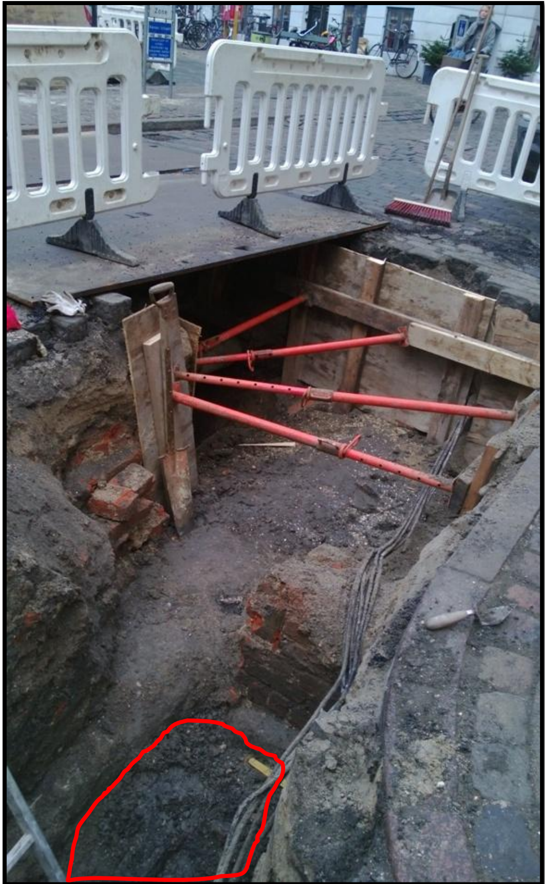
Figur 10 Den røde linje angiver laget med opfyld (S100008) der grænser op imod Murpartiet (S100002). Billedet er taget fra øst ind imod Gråbrødre torv.