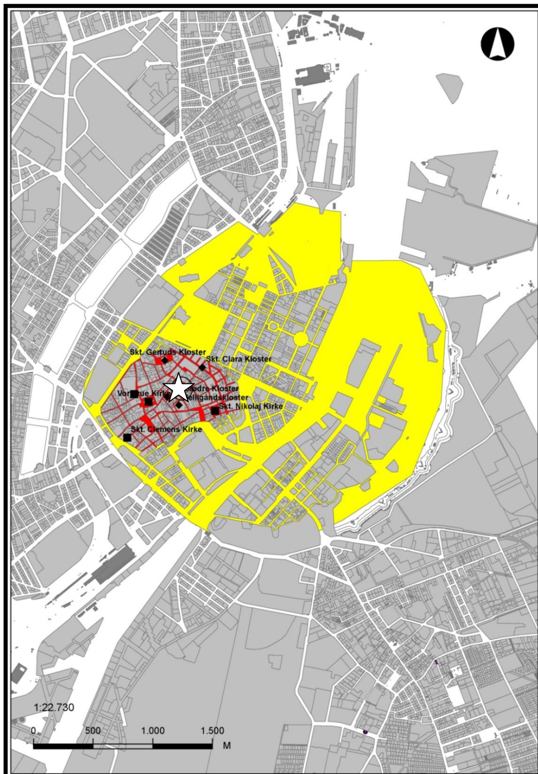
Figur 1 Oversigt over middelalderbyen (angivet med rødt) Renæssanceudvidelsen (gult) Udgravning er situeret i middelalderbyen og er angivet med en hvid stjerne, ved det nedrevne gråbrødre klosteret. Københavns Museum 2013.