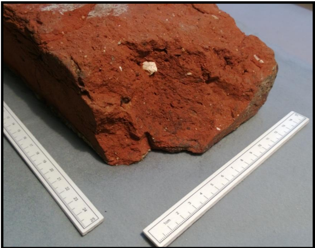
Figur 8 Recent brudflade på munkesten fra mur (S10002). Københavns Museum 2013.