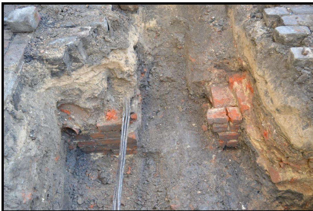
Figur 5 Et kig ned i grøften på Niels Hemmingsens gade. Løvstræde begynder umiddelbart til venstre for billedet. Murens inderste del er 1,3 meter fra den Nuværende facaderække. Københavns Museum 2013.

Der var så godt som intet daterbart materiale i grøften, der blev fundet et lille skær fra en stjørtotte i opfyldet op imod muren, feltdateret til midten af 1600-tallet. Derudover var der nogle få dyrekogler, der forekom sekundært deponeret. (Solide knogleelementer, med mærker efter gnavnede tænder fra dyr og begyndende forvitring) Det formodes, at den oprindelige overflade der har knyttet sig til muren, ligger dybere end grøften. De dele af muren der er fremme på billederne blev efterfølgende fjernet for at gøre plads til fjernvarme.