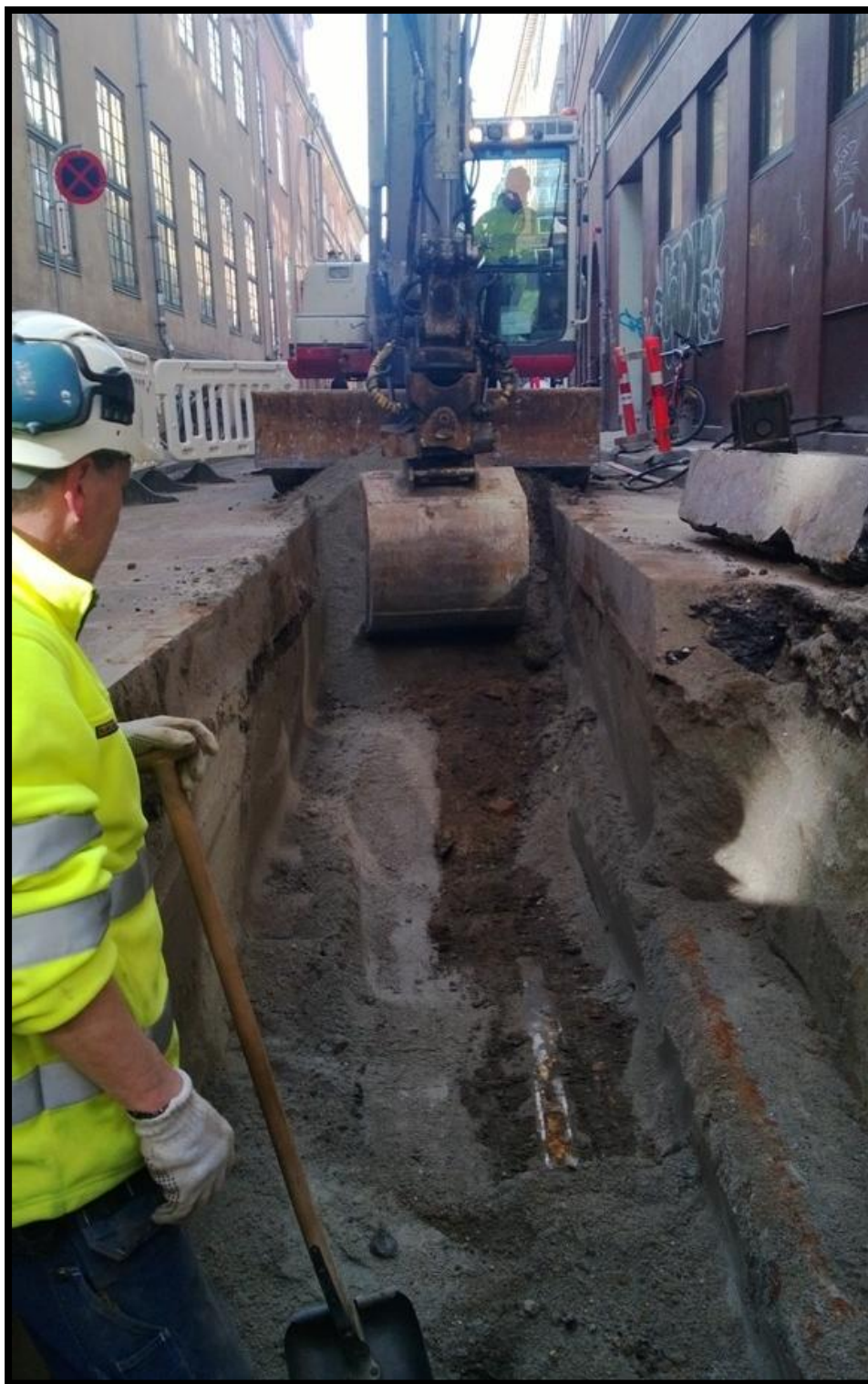
Figur 11 Løvstræde er til en dybde af 1,5 meter forstyrret af moderne nedgravninger der er igenfyldt med stabilgrus. Gaden har igen arkæologisk interesse med mindre der graves dybere end 1,5 meter og den eventuelle dybde som rørene måtte have. Københavns Museum 2013.

Løvstræde var forstyrret af moderne nedgravninger langs hele gaden, der blev gravet til en dybde af 1,5 meter.