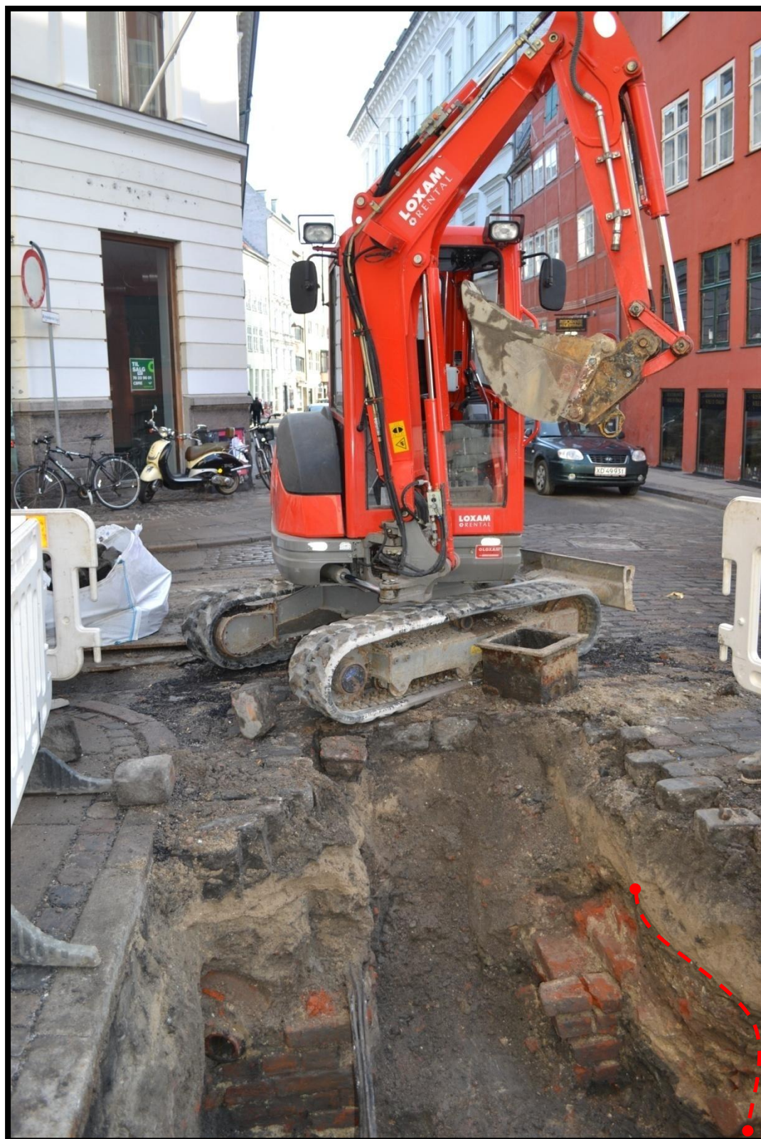
Figur 6 Arbejdsbillede, Niels Hemmingsens gade set fra nord, med Løvstræde umiddelbart til venstre. Den røde stiplede linje angiver et lag, der tolkes som den øverste del af den stadig stående mur, muren er (blevet) væltet og har dannet en ny overflade. Laget bestod af store fragmenter af munkesten opblandet med sand. Københavns Museum 2013.