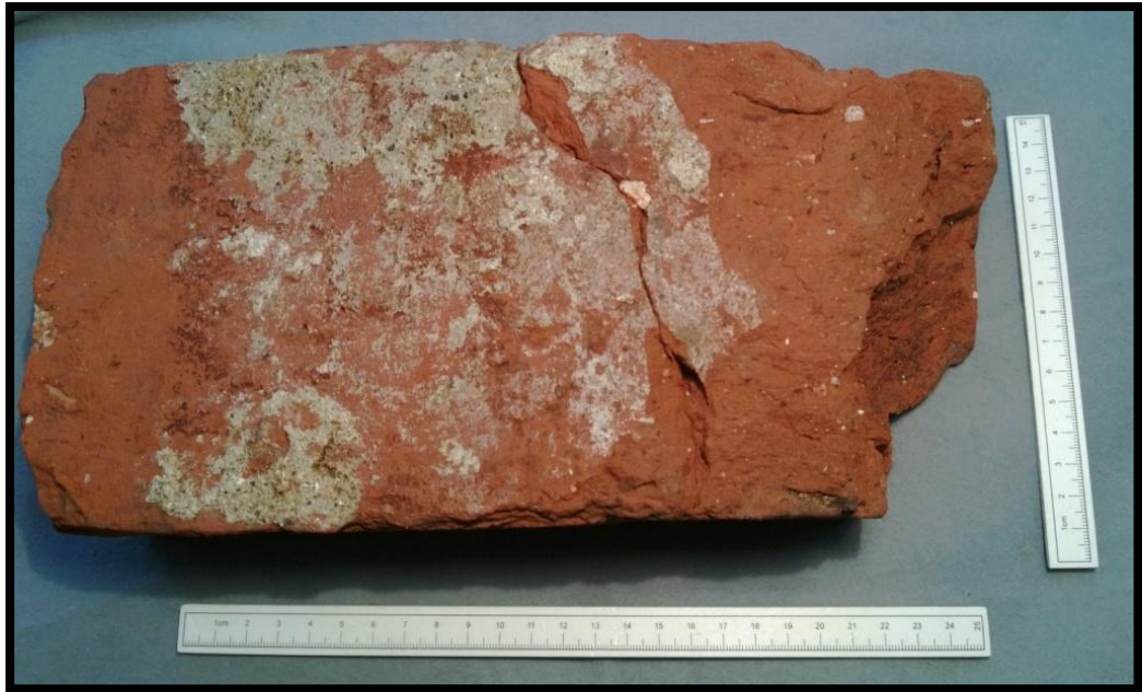
Figur 7 En de mursten der sad i mur (S10002) Murstenenes mål var i snit: 28x13,5x8 cm. Københavns Museum 2013.