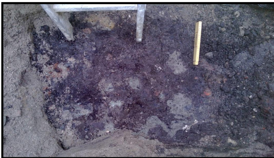
Figur 9 Kulturlag umiddelbart syd for en mur. Laget formodes at være resterne af et stabiliseringslag til en nu fjernet brolægning. Københavns Museum 2013.

Et kompakt lerholdigt kulturlag med opblandet organisk materiale, lå umiddelbart syd for det registrerede murparti (S100002) Det antages, at det drejer sig om et stabiliseringslag for en brolægning, der er fjernet, tolkningen er baseret på de spredte irregulære klumper af ler, der ligger som tynde plagamer i overfladen. Det formodes, at det drejer sig om pøle, der er dannet umiddelbart efter fjernelsen af brolægningen. Laget er ikke fuldstændigt udgravet. Laget er tolket til at være efterreformatorsk, da det støder op imod den nordfor liggende mur. Laget var fundsterilt. Det blev gennemgået med metaldetektor uden resultat.