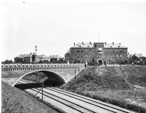
Kortudsnit: År 1879 og 1939. Historisk Atlas.

Hærens Gymnastikskole ses som den korsformede bygning på kortet fra 1939 nedenfor. Hele idrætsanlægget indgår i de kulturhistoriske bevaringsinteresser.