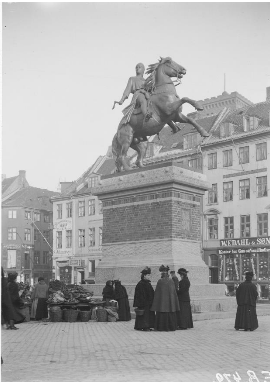
Statue af Absalon på Højbro Plads.

I forbindelse med mit phd-arbejde er nye kulstof 14-dateringer blevet lavet på knogler fra begge kirkegårde og på materiale fra den ældste bebyggelse. De nye datoer tyder på, at bosættelser og kirkegårde allerede blev etableret i første halvdel af 1000-tallet. Det er mindst 50 år tidligere end, hvad arkæologer tidligere troede og 150 år tidligere end Absalons indtræden på banen.