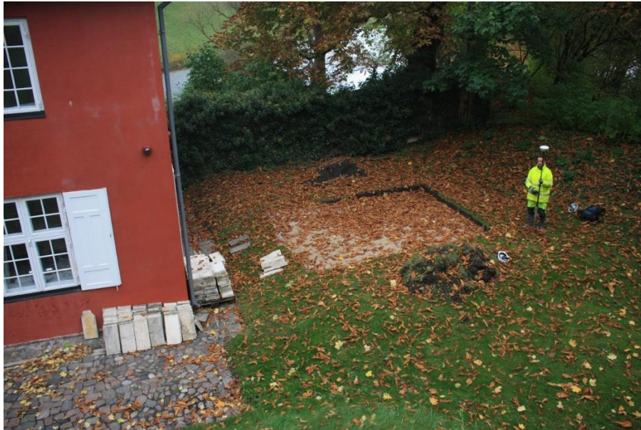
Figur 3. Indmåling af terrasse-området d. 24. oktober 2017. Set mod NNØ