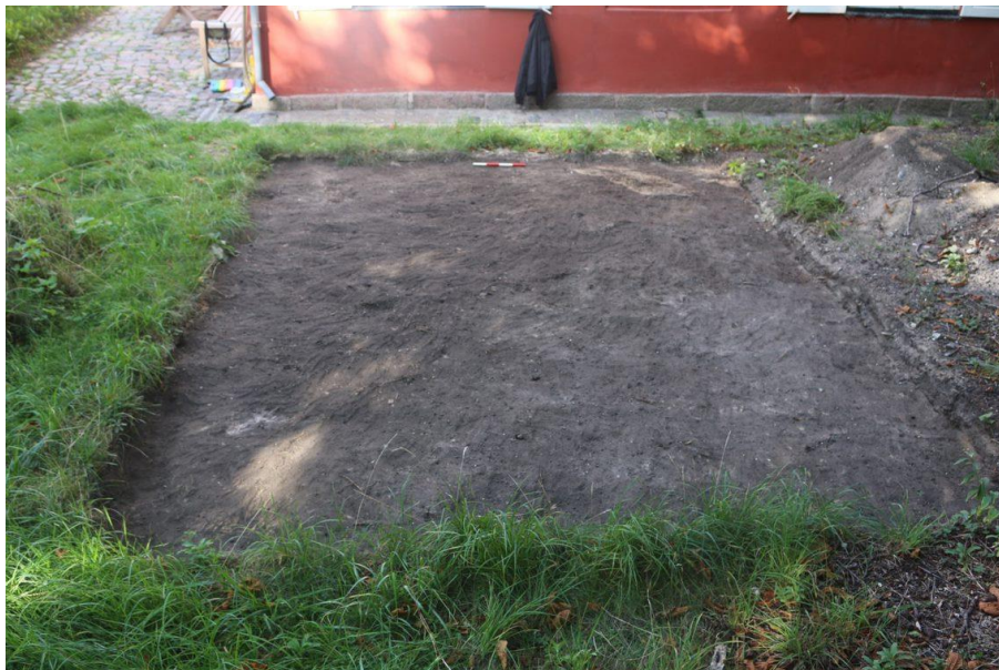
Figur 4. Det afgravede areal ved registreringen i september 2018 efter afrensning med graveske. Smedehuset ses i baggrunden.