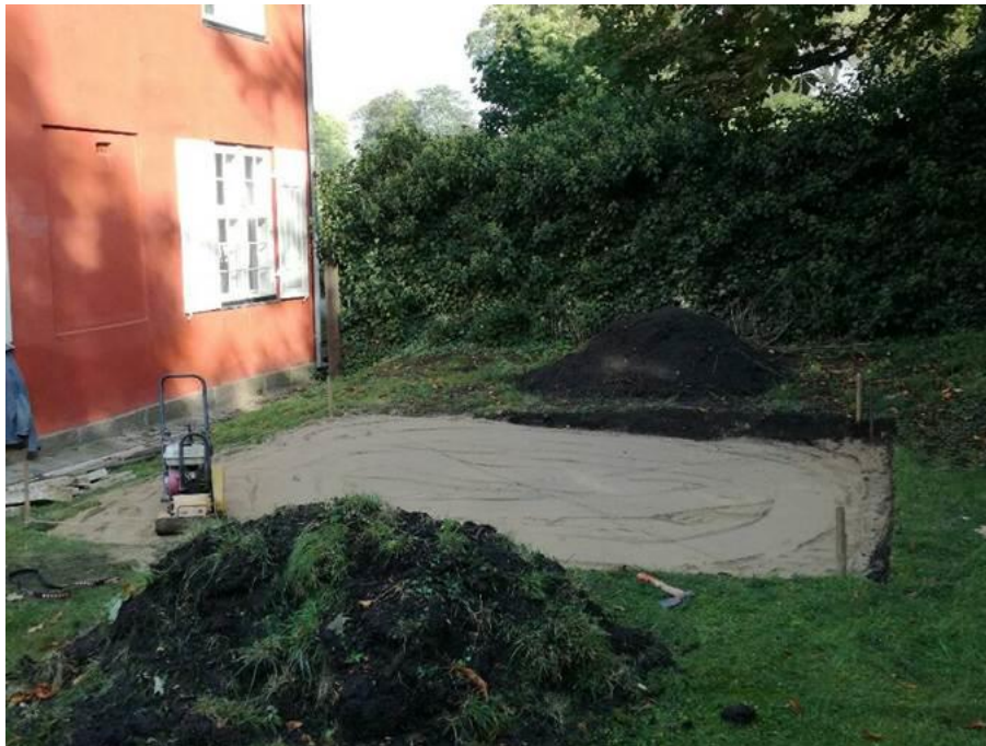
Figur 2. Fra september 2017: Blik mod nord med den nyligt stampede, sandfyldte terrasseafgravning.

På A3 tegnefolie blev fladen tegnet i 1:100 og gavlen på Smedehuset indtegnet til senere georeferering. På trods af den ringe dybde blev der udført en profiltegning i 1:20 af den dybeste profil mod øst.