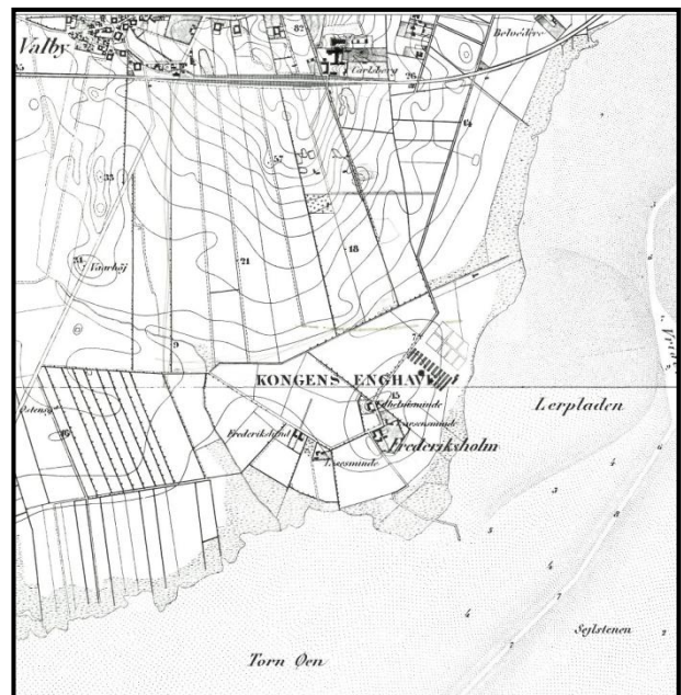
Fig. 2. Udsnit af Generalstabskort fra 1854. Bemærk lerpladen øst for Frederiksholm. Fra Bydelsatlas Kgs. Enghave 1993, s. 6.