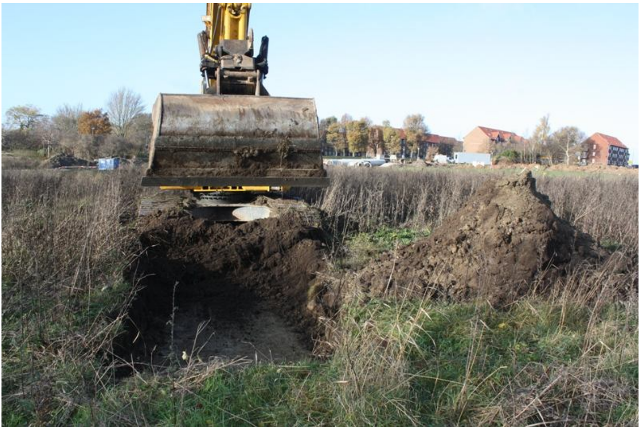
Figur 2. Gravning af søgegrøft.

Ligeledes blev 3 planlagte søgegrøfter på grundens sydligste del lagt sammen til én enkelt langsgående grøft pga. eksisterende bevoksning i området.