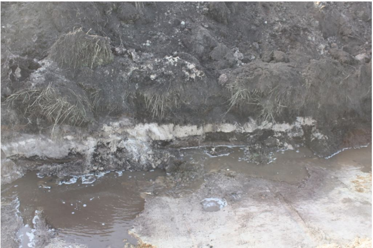
Figur 3. Søgegrøften øst for Harrestrup Å. Tørven ses under det lyse sandlag.

Afgrænsningen blev indmålt, men hvorvidt den oprindelige åbred har stået uforstyrret på strækket eller har været forstyrret af oprensninger kunne ikke afgøres.