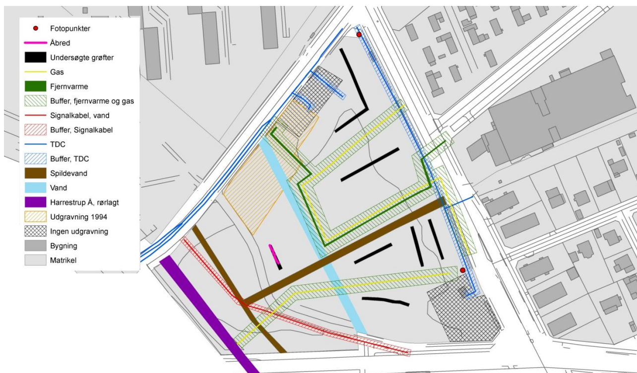
Figur 1. Plan over området med ledningsforstyrrelser indtegnet. De udlagte søgegrøfter er markeret med sort, mens de aftalte fotopunkter er markeret med en rød prik.

Ved nærværende forundersøgelse vanskeliggjordes dette i nogen grad af de mange ledningsføringer på grunden, og de udlagte søgegrøfter blev som resultat heraf udlagt med hensyntagen til områdets eksisterende ledninger samt arealets topografi og øvrige igangværende anlægsarbejder på grunden, men efter forholdende dækkende.